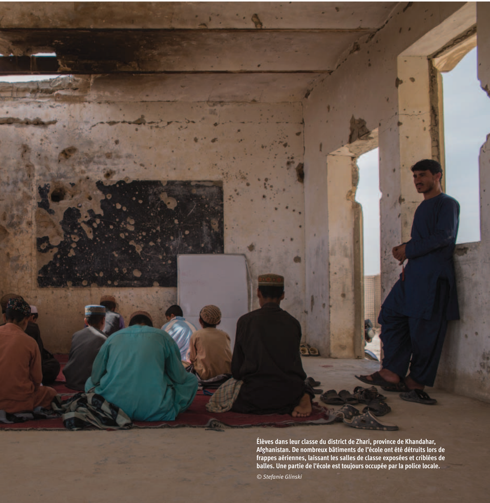
Élèves dans leur classe du district de Zhari, province de Khandahar, Afghanistan. De nombreux bâtiments de l'école ont été détruits lors de frappes aériennes, laissant les salles de classe exposées et criblées de balles. Une partie de l'école est toujours occupée par la police locale.