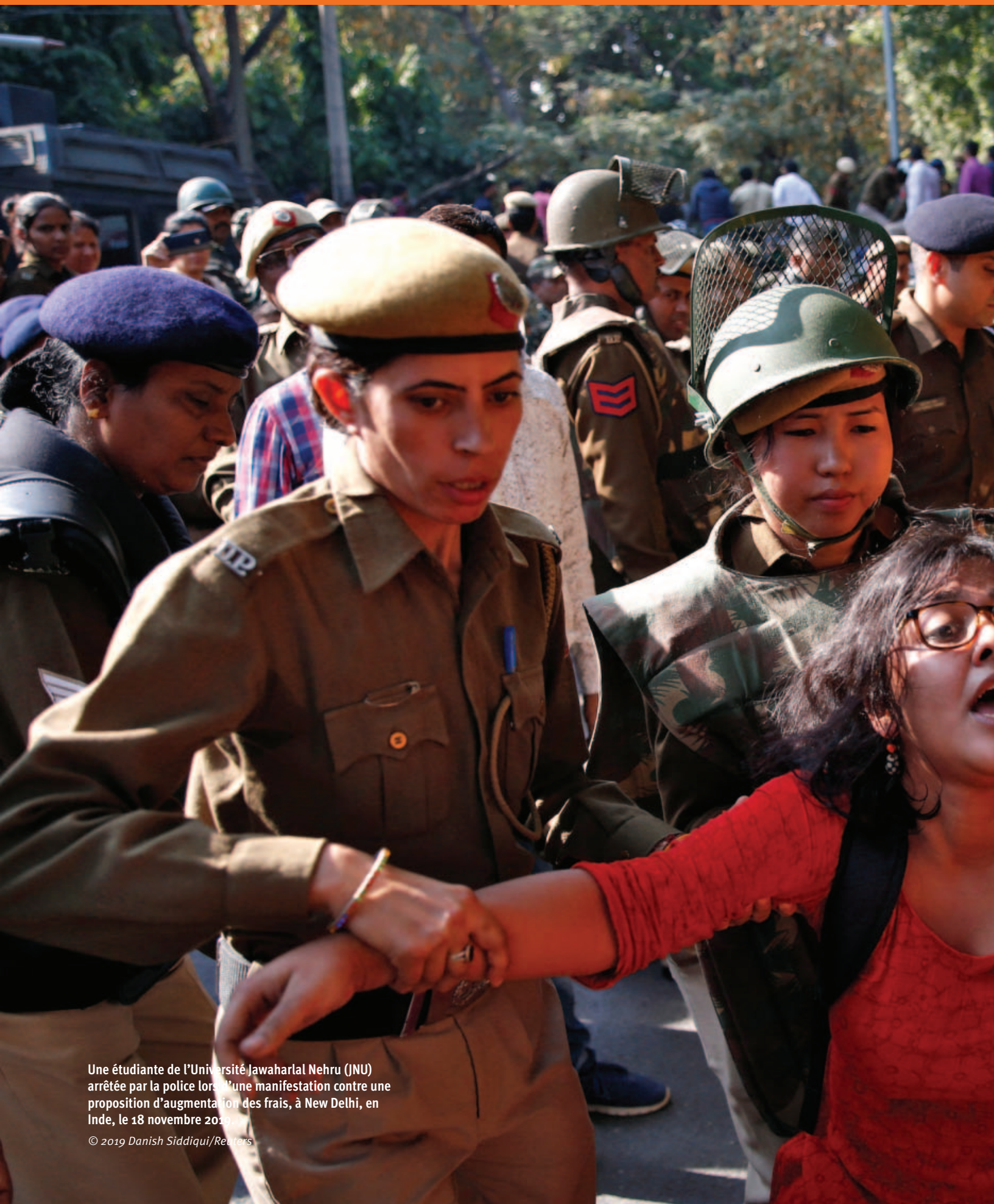
Une étudiante de l'Université Jawaharlal Nehru (JNU) arrêtée par la police lors d'une manifestation contre une proposition d'augmentation des frais, à New Delhi, en Inde, le 18 novembre 2019.