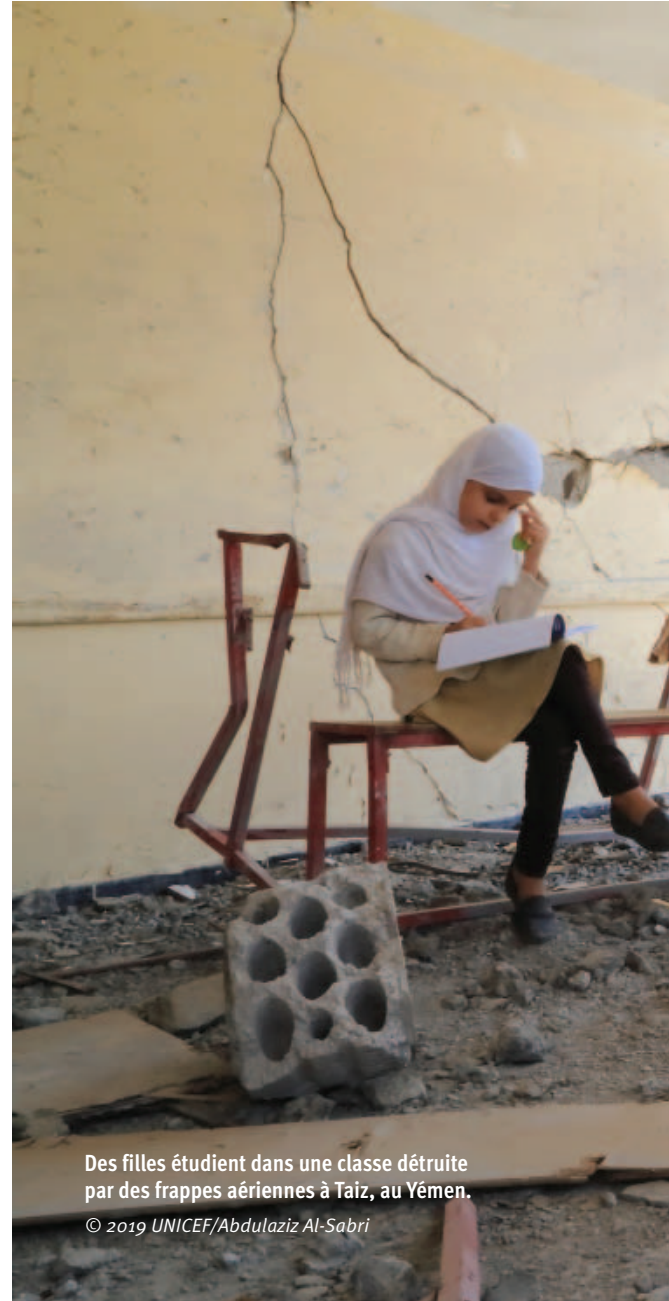
Des filles étudient dans une classe détruite par des frappes aériennes à Taiz, au Yémen.

L'Éducation prise pour cible 2020 documente les attaques contre l'éducation dans les situations de conflit armé et d'insécurité entre le 1 er janvier 2017 et le 31 décembre 2019. Chacun des 37 pays décrits dans L'Éducation prise pour cible 2020 a connu au moins dix attaques signalées contre l'éducation ou l'utilisation militaire d'établissements d'enseignement en 2017 et 2018, les deux premières années de la période couverte. De plus, les sections Vue d'ensemble mondiale