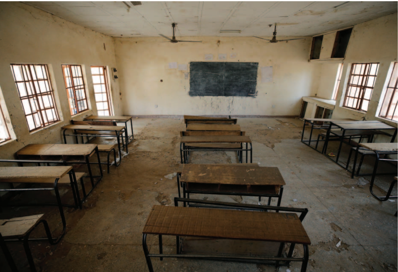
Une salle de classe vide à l'école de Dapchi, au Nigéria, où Boko Haram a enlevé plus de 100 filles en février 2018.