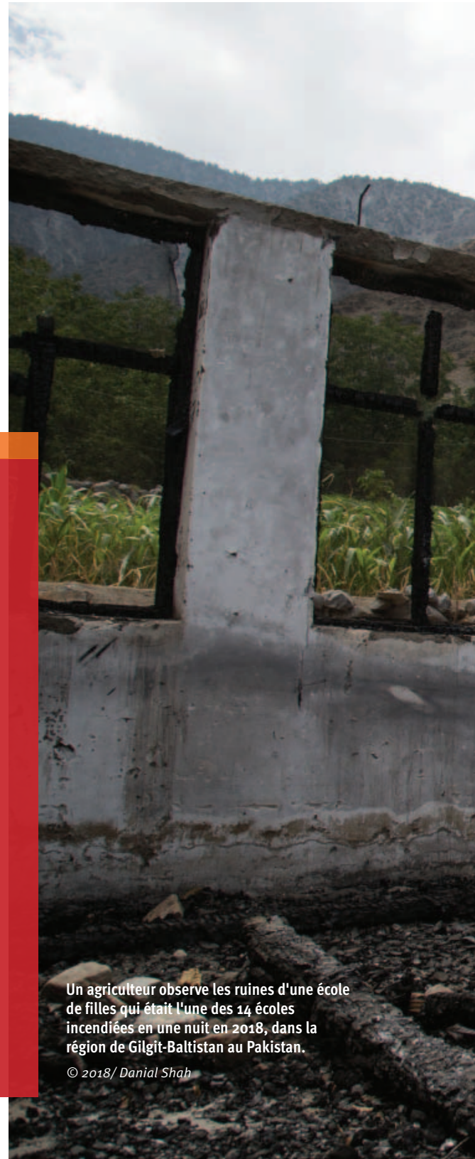
Un agriculteur observe les ruines d'une école de filles qui était l'une des 14 écoles incendiées en une nuit en 2018, dans la région de Gilgit-Baltistan au Pakistan.

Human Rights Watch et l'ONU ont constaté que le 24 novembre 2018, les forces progouvernementales en Syrie avaient lancé trois projectiles de mortier assistés par roquettes en direction de l'école primaire Al-Khansaa à Jarjanaz, dans le gouvernorat d'Idlib en Syrie. Environ 200 étudiants, âgés de 8 à 13 ans, s'y trouvaient à ce moment-là. L'attaque a tué un enseignant et cinq élèves, blessé neuf autres élèves et endommagé le bâtiment de l'école. « Le bruit de l'explosion, c'est la première fois que nous entendons quelque chose comme ça, c'était énorme, très, très terrifiant et très dangereux », a déclaré un employé de l'école à Human Rights Watch. « Nous avons essayé de contrôler la situation. Nous avons placé tout le monde entre deux bâtiments. Nous avons fermé les portes, nous ne voulions pas les laisser sortir. Certains, cependant, sont partis avec le professeur, et le deuxième [projectile] est tombé là où ils se trouvaient, à 25 mètres. L'école était la cible. » À la suite de l'attaque et des attaques subséquentes contre la ville, de nombreux habitants ont fui, forçant l'école à fermer. Un administrateur de l'école a déclaré à Human Rights Watch : « Il n'y a plus personne. S'il n'y a pas de citoyens et pas d'élèves, qui ouvrira les écoles ? »