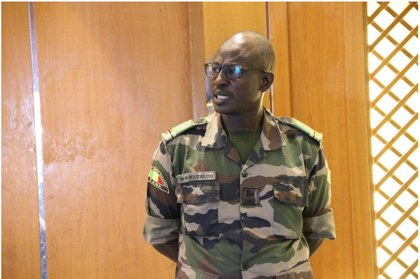
Lieutenant-Colonel Moussa Macalou, Focal Point of the Malian Ministry of Defense and Veterans within the SSD National Committee