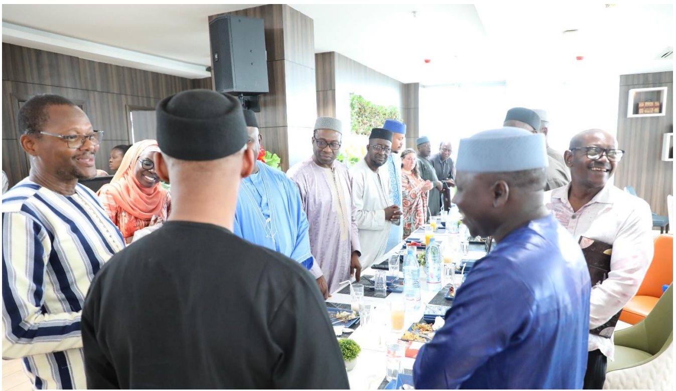
Lunch at the end of the visit with the Minister of Education's Head of Cabinet (on the right in blue) and the Secretary General of Mali's Ministry of Education (back in black).

On their return from Ségou, the Burkinabe delegation and the technical and financial partners were invited to a farewell lunch by the Secretary General of the Ministry of National Education. The lunch was an opportunity for both countries to express their gratitude for the organization and success of the visit, but also to encourage the participants to continue their efforts to implement the SSD.