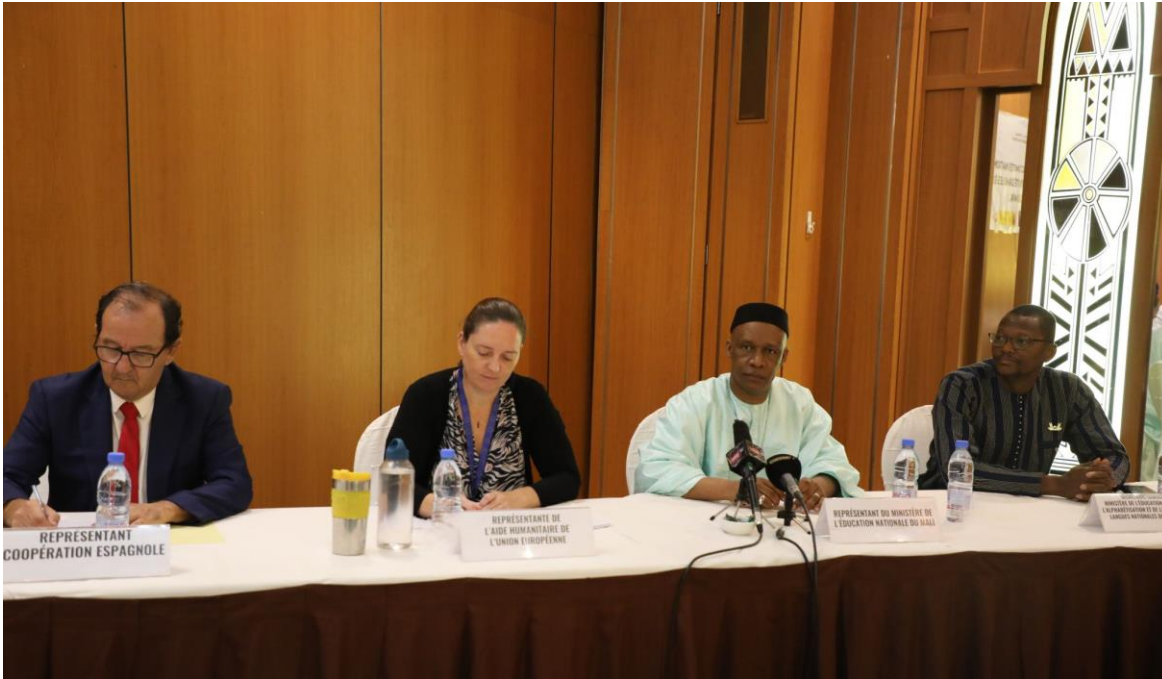
From left to right, the representative of the Spanish Agency for International Cooperation (AECID), the representative of ECHO, the Secretary General of the Ministry of Education of Mali, the Secretary General of the Ministry of Education of Burkina Faso.

The opening ceremony was attended by representatives of the ministries of education of Mali and Burkina Faso, donor agencies, international NGOs making up the national SSD committee in Mali, civil society and the press.