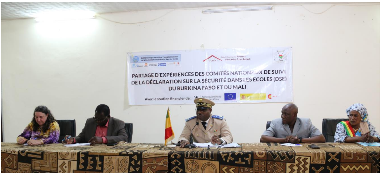
The Director of Cabinet of the Governor of Ségou opening the session with the regional committee

The day after the workshop, the Burkina Faso delegation, accompanied by some members of the Mali Committee, Save the Children and Plan International, traveled to Ségou to meet with the SSD Regional Committee, one of 9 regional committees operating in Mali.