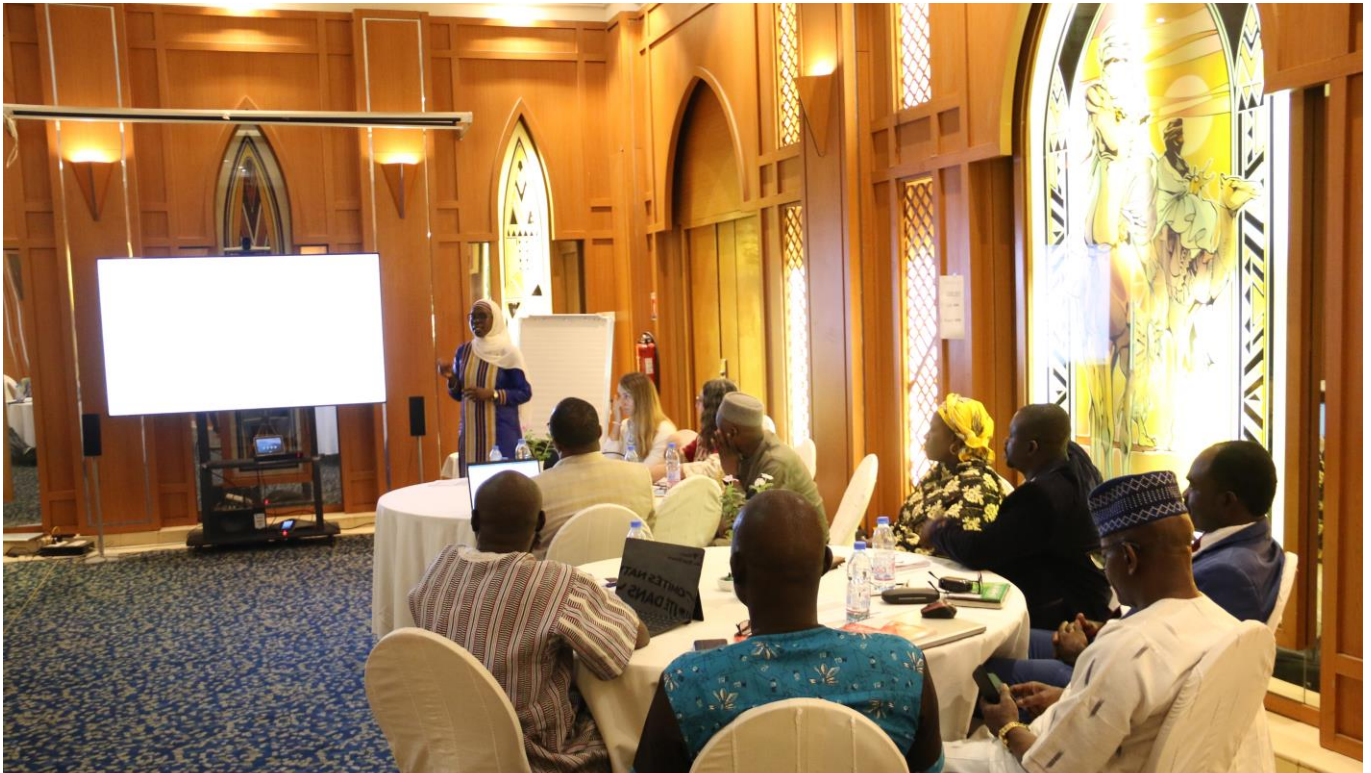
Photo taken during workshop

The main aim of the workshop was to enable participants to share good practice in preventing and mitigating the impact of attacks on education through the work of national and local technical committees and their action plans, and to discuss the challenges to be met in order to guarantee access to safe, quality education. The aim was also to exchange views on the collection and analysis of data on attacks on education and school closures, while encouraging closer cooperation, the sharing of experiences and mutual technical support between the national technical committees in Mali and Burkina Faso.