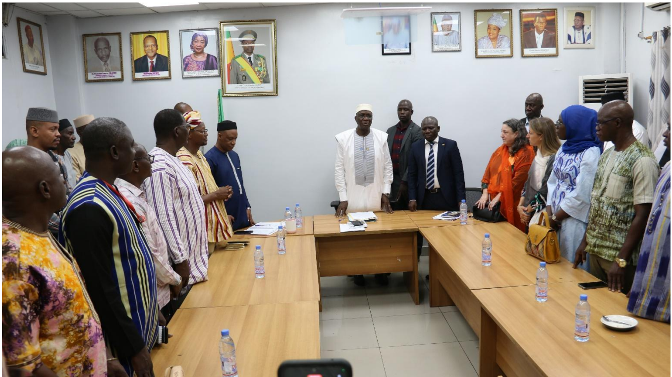
His Excellency Dr. Amadou Savané Sy, Mali's Minister of National Education, and his cabinet receive the Burkinabe delegation visiting Mali, as well as partners

Accompanied by his cabinet, which included the Ministry's Secretary General , the Minister's Chief of Staff and the Ministry's representatives at local levels , the Minister welcomed the Burkina Faso SSD delegation. In his speech, he noted the importance of ensuring the security of school premises, while reiterating his ministry's support to such initiatives to ensure the continuity of education at times of conflict.