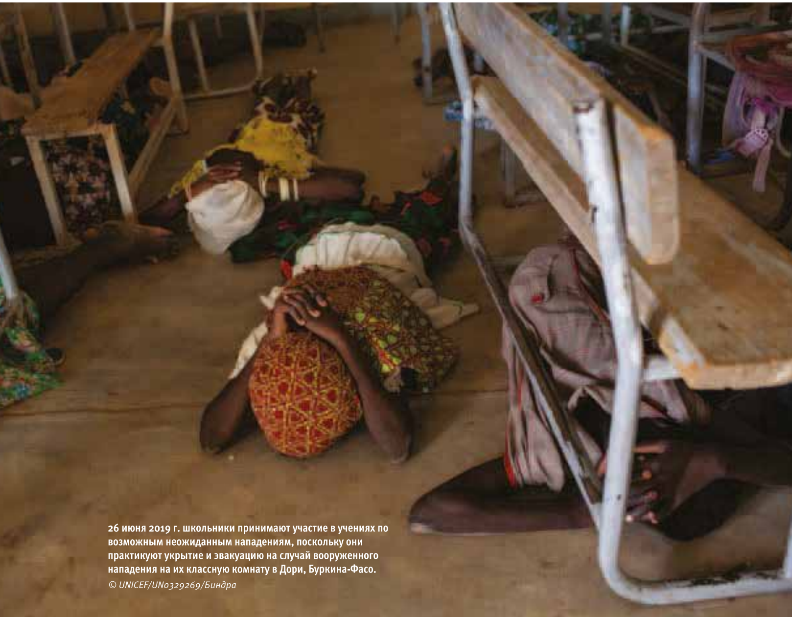
26 июня 2019 г. школьники принимают участие в учениях по возможному неожиданному нападению, поскольку они практикуют укрытие и эвакуацию на случай вооруженного нападения на их классную комнату в Дори, Буркина-Фасо.