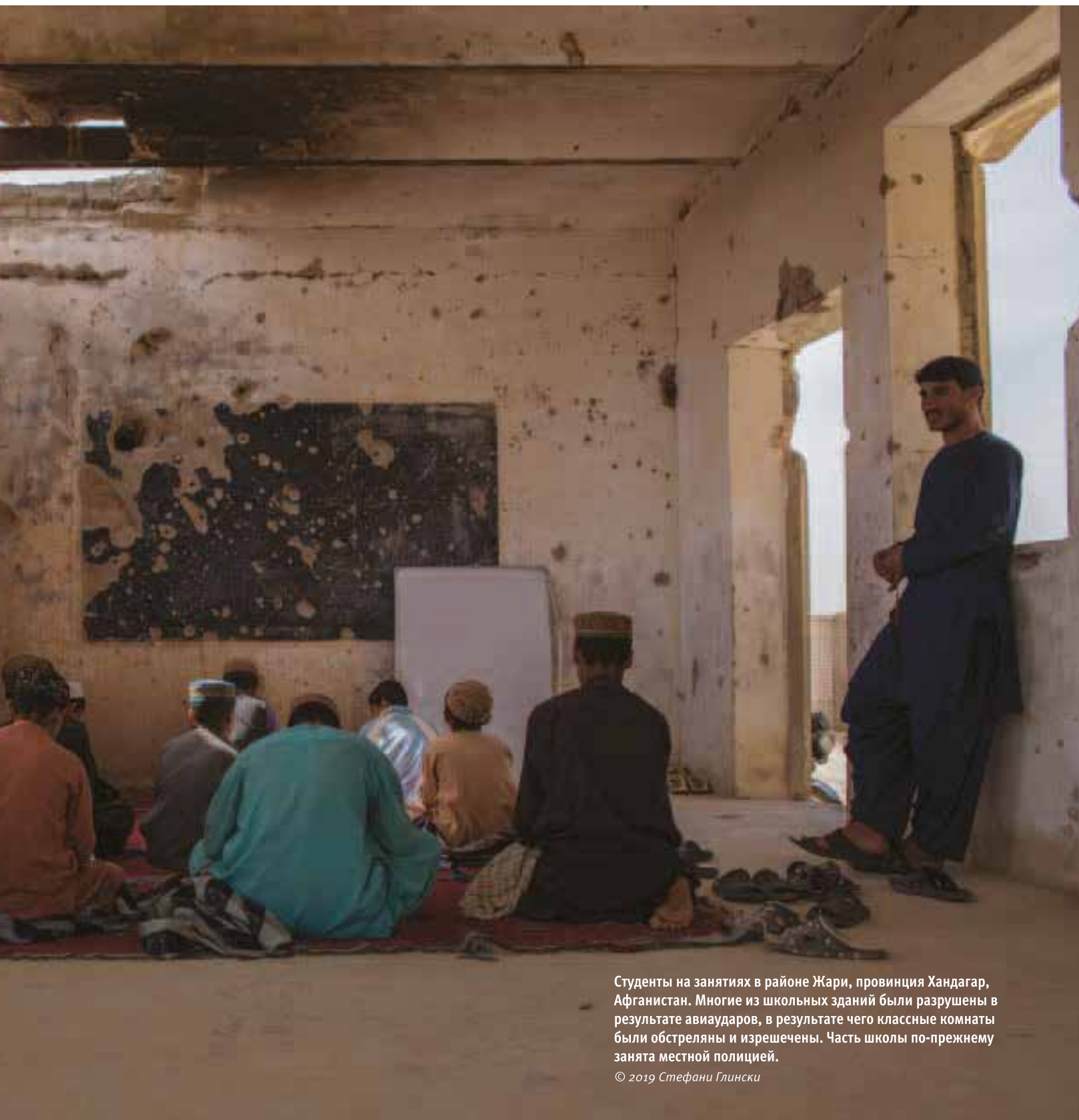
Студенты на занятиях в районе Жари, провинция Хандагар, Афганистан. Многие из школьных зданий были разрушены в результате авиаударов, в результате чего классные комнаты были обстреляны и изрешечены. Часть школы по-прежнему занята местной полицией.