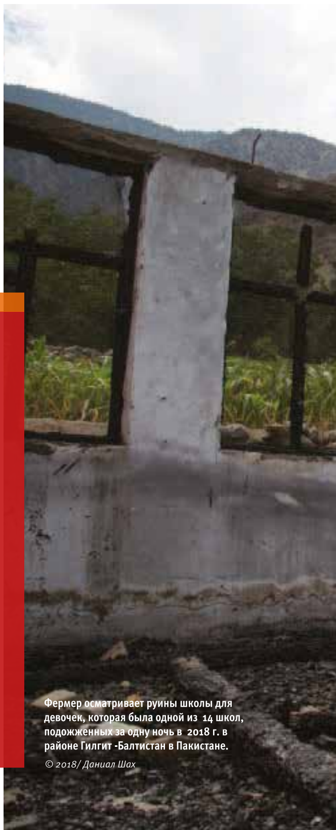
Фермер осматривает руины школы для девочек, которая была одной из 14 школ, подожженных за одну ночь в 2018 г. в районе Гилгит -Балтистан в Пакистане.

После нападения на школу и последующие нападения на город многие жители убежали, заставив закрыть школу. Один администратор школы сказал «Human Rights Watch»: «Там никого не осталось. Если нет граждан и нет учеников, кто откроет школы?»