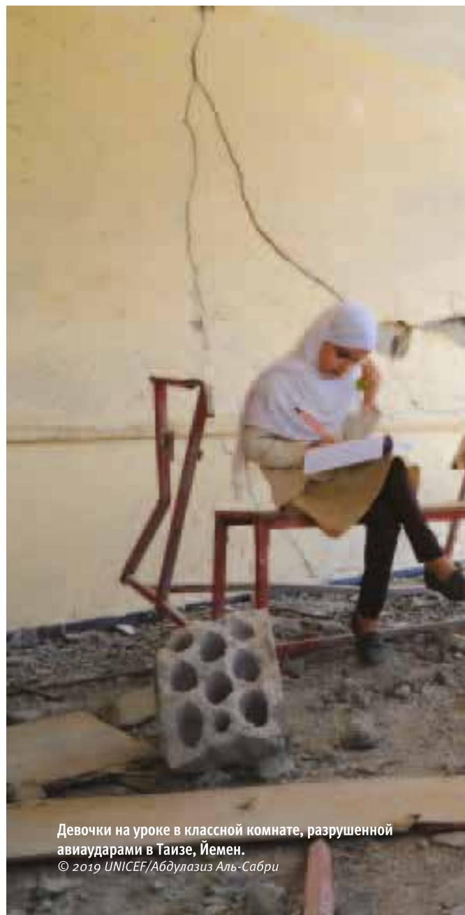
Девочки на уроке в классной комнате, разрушенной авиаударами в Таизе, Йемен.

В докладе «Нападения на образование в условиях вооруженного конфликта 2020» зафиксированы нападения на учебные учреждения в ситуациях вооруженного конфликта и отсутствия безопасности в период с 1 января 2017 г. по 31 декабря 2019 г. В каждой из 37 стран, представленных в докладе «Нападения на