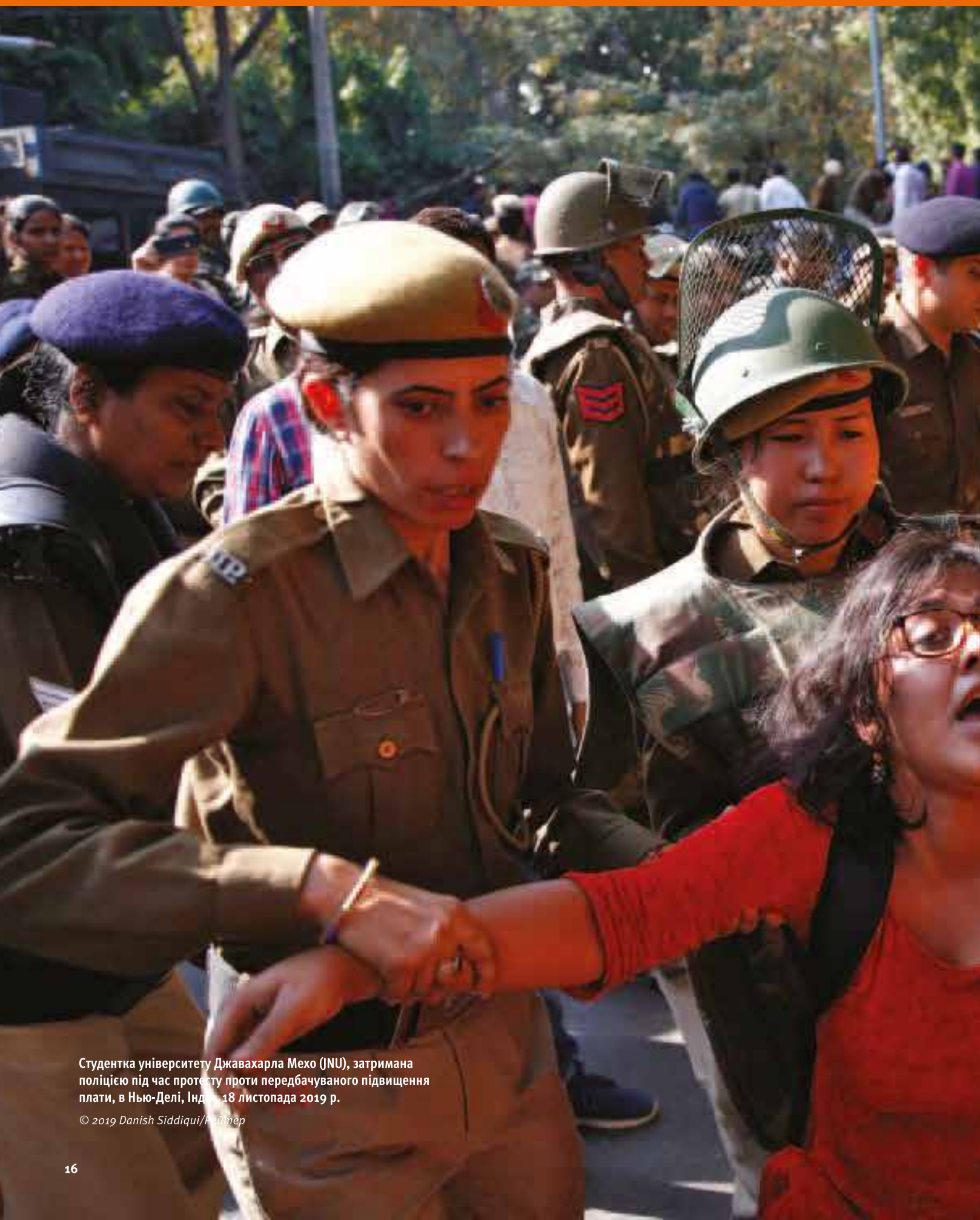
Студентка університету Джавахарла Мехо (JNU), затримана поліцією під час протесту проти передбачуваного підвищення плати, в Нью-Делі, Індія, 18 листопада 2019 р.