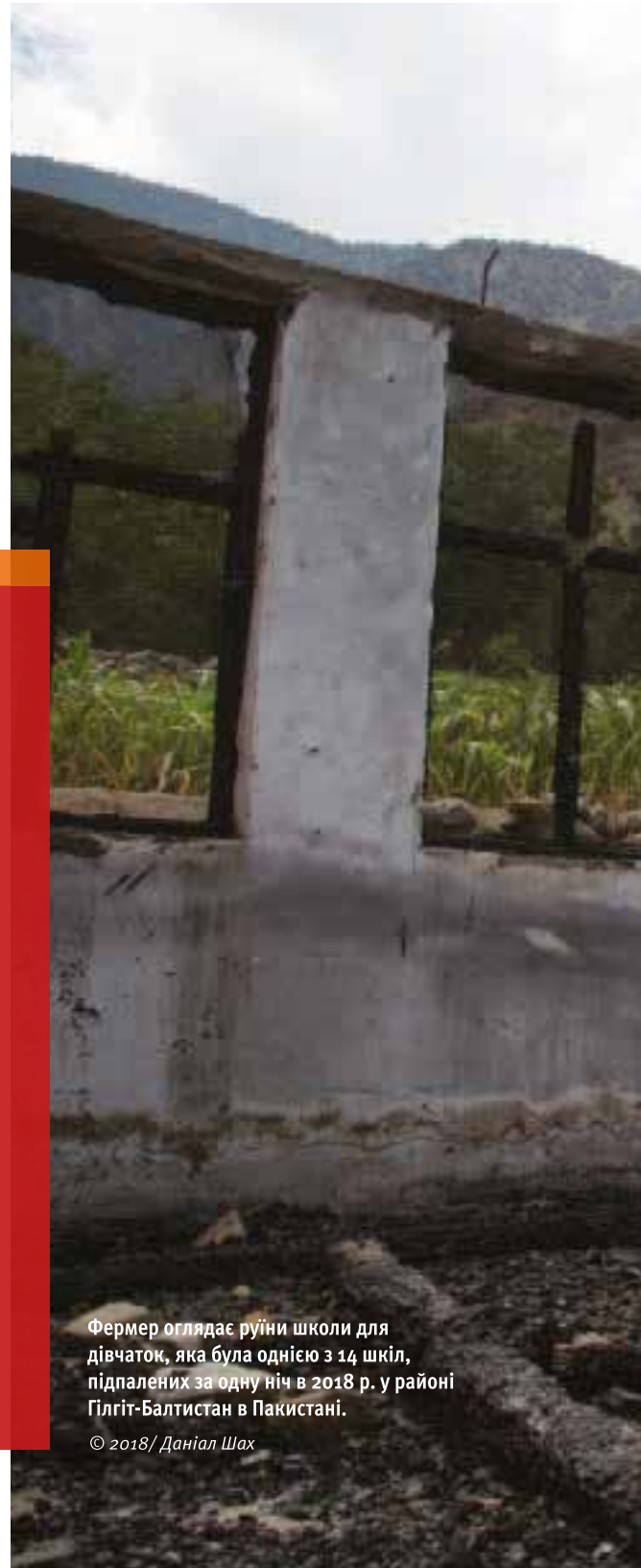
Фермер оглядає руїни школи для дівчаток, яка була однією з 14 шкіл, підпалених за одну ніч в 2018 р. у районі Гілгіт-Балтистан в Пакистані.

Після нападу на школу і подальших нападів на місто багато жителів втекли, змусивши закрити школу. Один адміністратор школи сказав «Human Rights Watch»: «Там нікого не залишилося. Якщо немає громадян і немає учнів, хто відкриє школи?»